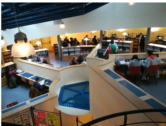
Photo du CDI du lycée

Les cours d'EPS sont dispensés soit dans le gymnase ou au terrain multisport, soit dans des lieux externes au lycée.