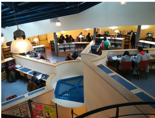
Photo du CDI du lycée

Les cours d'EPS sont dispensés soit dans le gymnase ou au terrain multisport, soit dans des lieux externes au lycée.