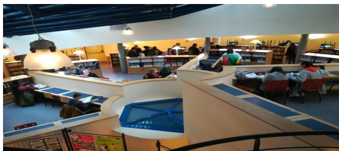
Photo du CDI du lycée

L'établissement dispose d'une grande cour et d'un espace fumeur extérieur dans son enceinte. Les salles de classe sont réparties sur 3 étages. Les cours d'EPS sont dispensés soit dans le gymnase ou au terrain multisport, soit dans des lieux externes au lycée.