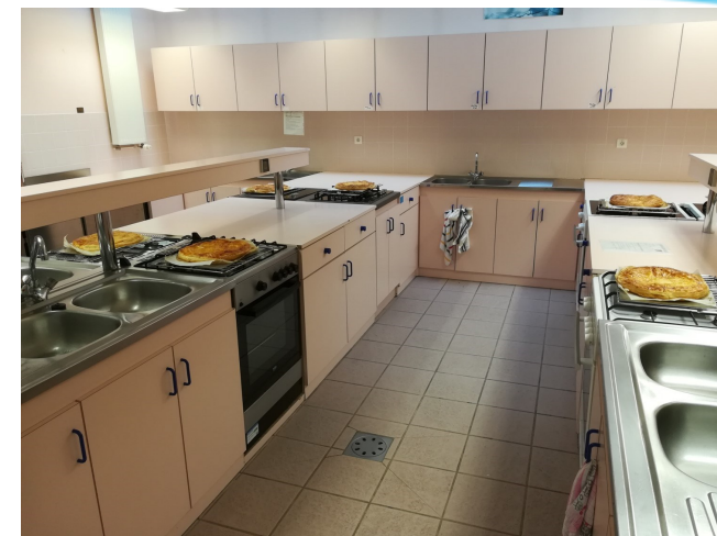
Salle nutrition : préparation de collations