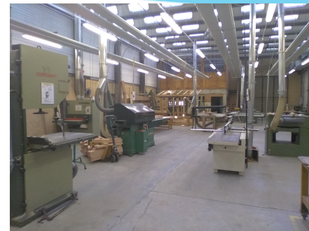
Atelier charpentier bois

Le volume horaire du CFA est de 11h d'enseignement professionnel et de 14h d'enseignement général.